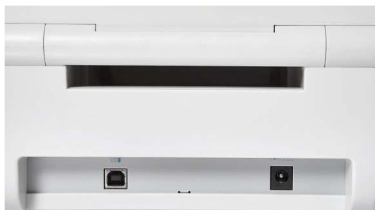
Самый популярный USB-интерфейс в базовой комплектации