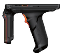
RFID - версия