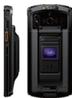
Фингерпринт - версия