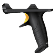
Сканер штрих-кода с триггером