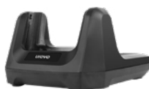
Зарядная станция (Cradle)