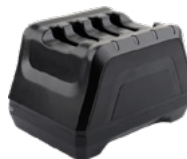
4-х зарядная станция для батарей