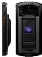
Фингерпринт - версия