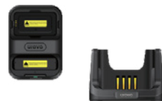
Подставка для подзарядки с одним разъёмом