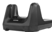
Зарядная станция (Cradle)