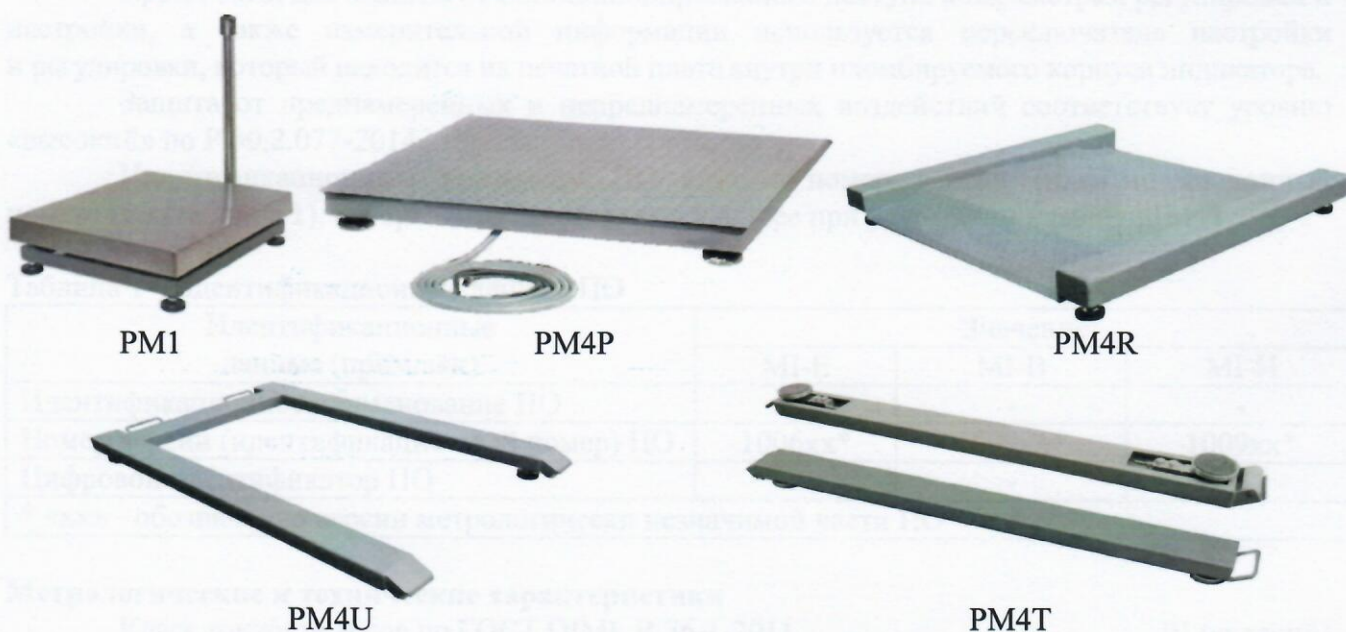
Рисунок 1 - Общий вид ГПУ весов

Схема пломбировки от несанкционированного доступа, обозначение места нанесения знака поверки представлены на рисунке 3.