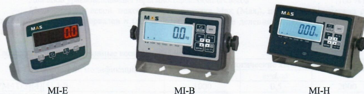
Рисунок 2 - Общий вид индикаторов