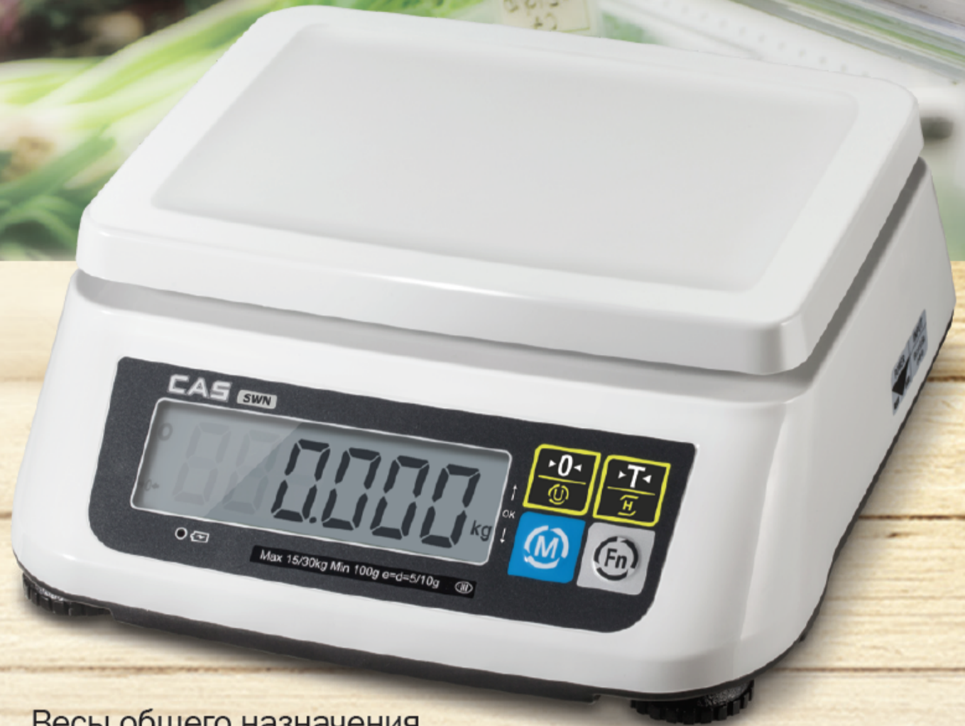
Весы общего назначения эконом-класса