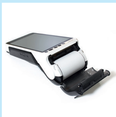
Большой рулон бумаги Ø40 мм