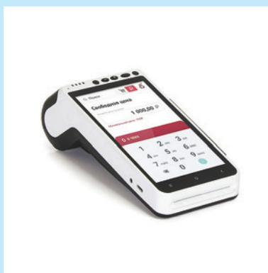
Интуитивный интерфейс программ