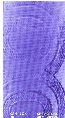
Орловский режим: ИК образ